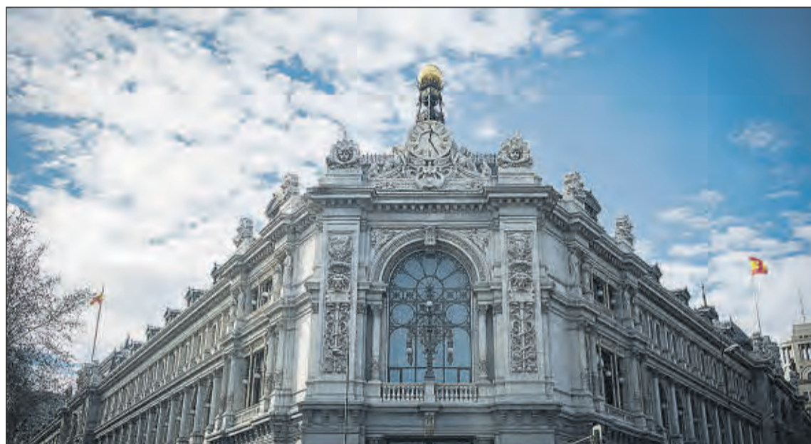
Sede del Banco de España. FERNANDO VILLAR

Según los datos de la patronal Inverco, en apenas un año y medio el